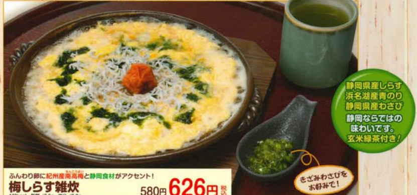
ふわりお粥に紀州産南高梅と静岡産素材がアクセント! 梅しらす雑炊 580円 626円 税込 440kcal 脂質/6.5g 塩分/8.3g

静岡県産しらす 浜名湖産青のり 静岡県産わかび 静岡ならではの 味わいです。 玄米緑茶付き!