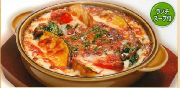
ミートドリアに色とりどりの野菜をトッピング! 野菜ミートドリア 680円 734円 税込 849kcal 脂質/39.3g 塩分/4.6g