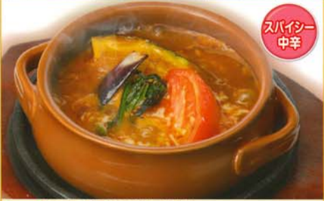
ハンバーグとの組み合わせもおすすめ! 焼き野菜カレー 460円 496円 税込 201kcal 脂質/8.3g 塩分/3.3g