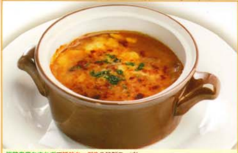
淡路産たまねぎで旨味たっぷりの特製スープ! オニオングラタンスープ 380円 410円 税込 167kcal 脂質/7.9g 塩分/1.9g