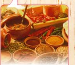
スパイシー中辛! 4種類の野菜が入った焼きカレー。だまねぎの甘さと、10種類以上のスパイスで煮込んだカレーは、ルーや化学調味料を極わずさらりとしてクセになる辛さ!