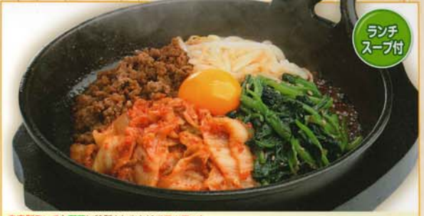
自家製ミンチと野菜に特製タレをかけてアツアツ! 鉄鍋ビビンバ 580円 626円 税込 633kcal 脂質/20.4g 塩分/4.7g