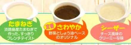
たまねぎ 淡路島産たまねぎで作った、すっきりフレッシュテイスト