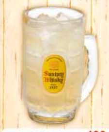
角ハイボール 400円 432円 税込 90kcal