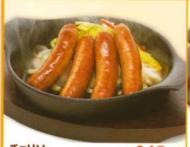
チヨリン 311kcal 脂質/27.1g 塩分/2.0g 320円 345円 税込