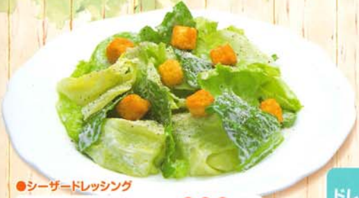
●シーザードレッシング シーザーサラダ 360円 388円 税込 196kcal 脂質/17.3g 塩分/0.6g