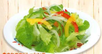
●さわやかドレッシング フレッシュサラダ 250円 270円 税込 63kcal 脂質/5.7g 塩分/0.4g