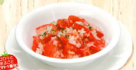
●たまねぎドレッシング 完熟トマトサラダ 280円 302円 税込 153kcal 脂質/11.4g 塩分/0.5g