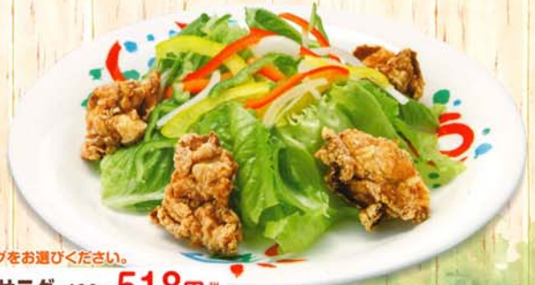
●ドレッシングをお選びください。 竜田揚げサラダ 480円 518円 税込 548kcal 脂質/41.0g 塩分/2.4g