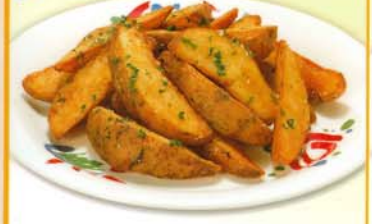
フライドポテト 324kcal 脂質/16.5g 塩分/0.7g 250円 270円 税込