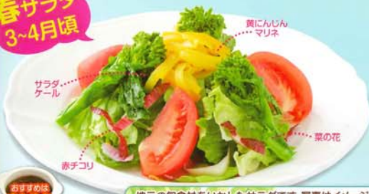
おすすめる さわやかドレッシング

地元の旬食材をいかしたサラダです。写真はイメージですので、食材は変わる場合がございます。お楽しみに! 季節で変わる! 農園サラダ 450円 486円 税込