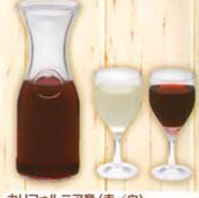
カリフォルニア産(赤/白) デカンタワイン 780円 842円 税込 400ml 292kcal(赤) 292kcal(白)