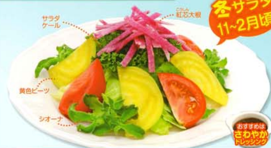
おすすめる さわやかドレッシング