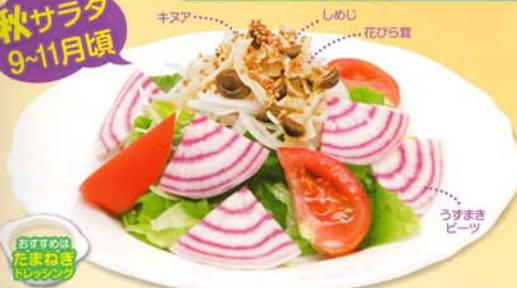
おすすめる たまねぎドレッシング