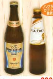
ザ・プレミアム・モルツ 580円 626円 税込 中ビン 237kcal