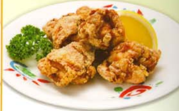
竜田揚げ 423kcal 脂質/29.6g 塩分/1.5g 280円 302円 税込