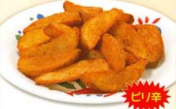
ピリ辛ポテト 331kcal 脂質/16.6g 塩分/1.3g 250円 270円 税込