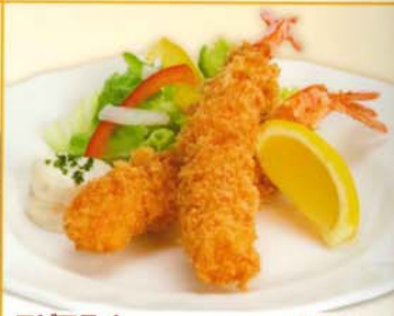
エビフライ 214kcal 脂質/13.2g 塩分/0.9g 380円 410円 税込