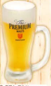
ザ・プレミアム・モルツ 生中ジョッキ 500円 540円 税込 128kcal