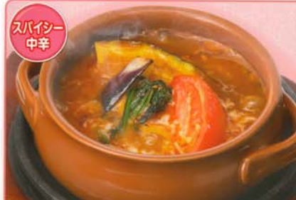
スパイシー 中辛 ルーや化学調味料を使わずクセになる辛さ！ 焼く野菜カレー 460円 496円 税込 201kcal 脂質/8.3g 塩分/3.3g