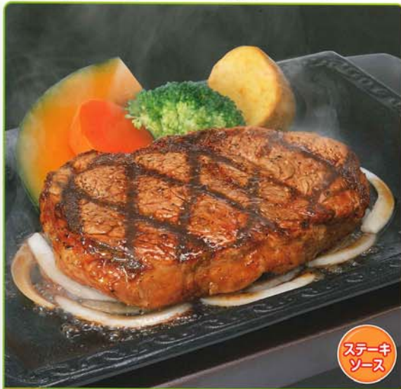
220g 厚切りジューシー！熟成リブロースです。 さわやがステーキ 692kcal 脂質/43.3g 塩分/2.6g 1,750円 1,890円 税込

指定した「牛種」「穀物肥育牛」のオーストラリア産リブロース肉を産地から子ルド輸送しています。食べ頃のおいしさにこだわって約40〜50日間低温熟成しています。自社工場ですべて「厚切りカット」、肉汁たっぷりジューシー！