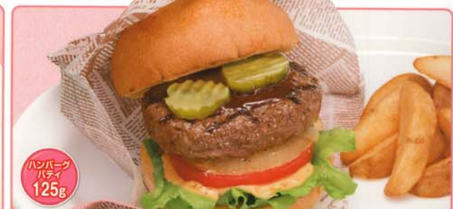
ハンバーグ パティ 125g フライドポテト 付き