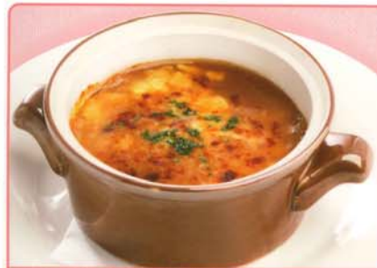
淡路島産たまねぎで旨味たっぷりの特製スープ！ オニオンラタンスープ 380円 410円 税込 252kcal 脂質/10.8g 塩分/3.4g