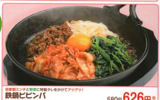
自家製ミンチと野菜に特製タレをかけてアツアツ！ 鉄鍋ビビンバ 580円 626円 税込 618kcal 脂質/20.3g 塩分/3.5g