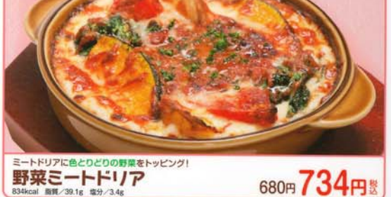
ミートドリアに色とりどりの野菜をトッピング！ 野菜ミートドリア 680円 734円 税込 834kcal 脂質/39.1g 塩分/3.4g