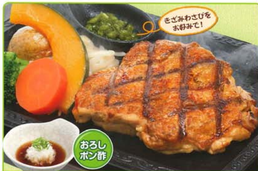
220g アツアツをおろしとわさびでスッキリどうぞ。 和風鶏ステーキ 587kcal 脂質/33.8g 塩分/5.3g 680円 734円 税込