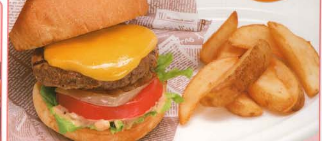
パティは牛肉100%・肉汁たっぷり！ 炭焼きバーガー 680円 734円 税込 838kcal 脂質/41.9g 塩分/4.2g オリジナルチeddarミックスチーズ！ 炭焼きチーズバーガー 740円 799円 税込 940kcal 脂質/50.4g 塩分/4.3g