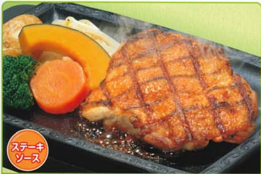
220g 皮はパリッ！炭焼きの香ばしさ。 炭焼き鶏ステーキ 566kcal 脂質/33.8g 塩分/4.3g 580円 626円 税込