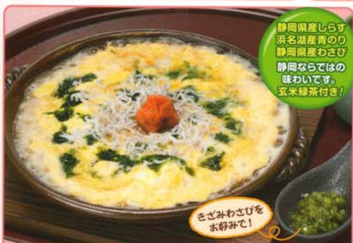
静岡県産しらす 浜名湖産青のり 静岡県産わさび 静岡ならではの味わいです。玄米緑茶付き！ ふわり卵に肥前産南高梅と静岡産食材がアクセント！ 梅しらす雑炊 580円 626円 税込 440kcal 脂質/6.5g 塩分/8.3g